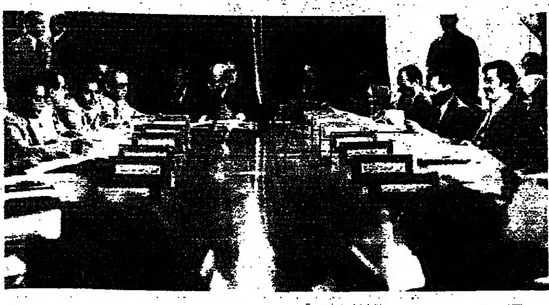
جلس الجامعة العربية خلال اجتماعه بالقاهرة امين الاول